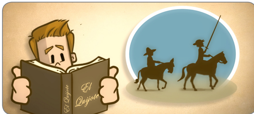
Figura 1. Comprensión textual