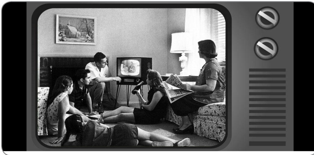
Figura 1. Evolución de la televisión