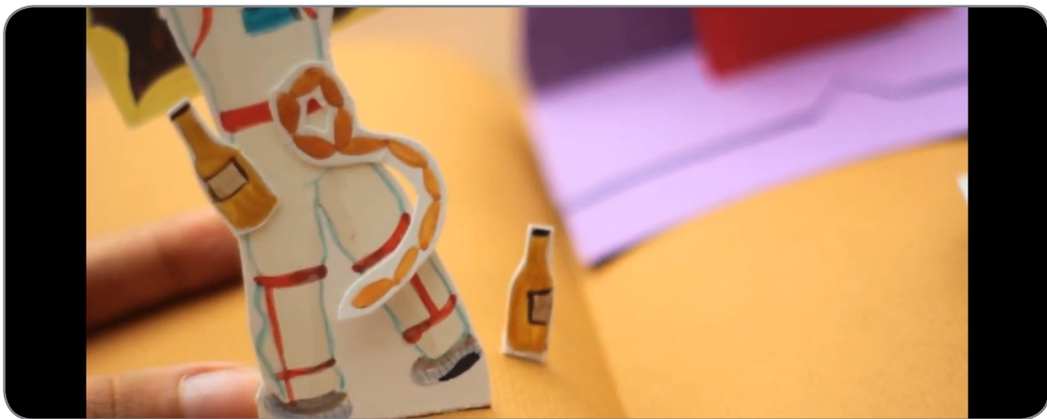
Figura 2 Reseña Crónicas marcianas

Observa con atención el siguiente vídeo sobre la reseña del libro Crónicas Marcianas de Ray Bradbury. Luego responde las preguntas.